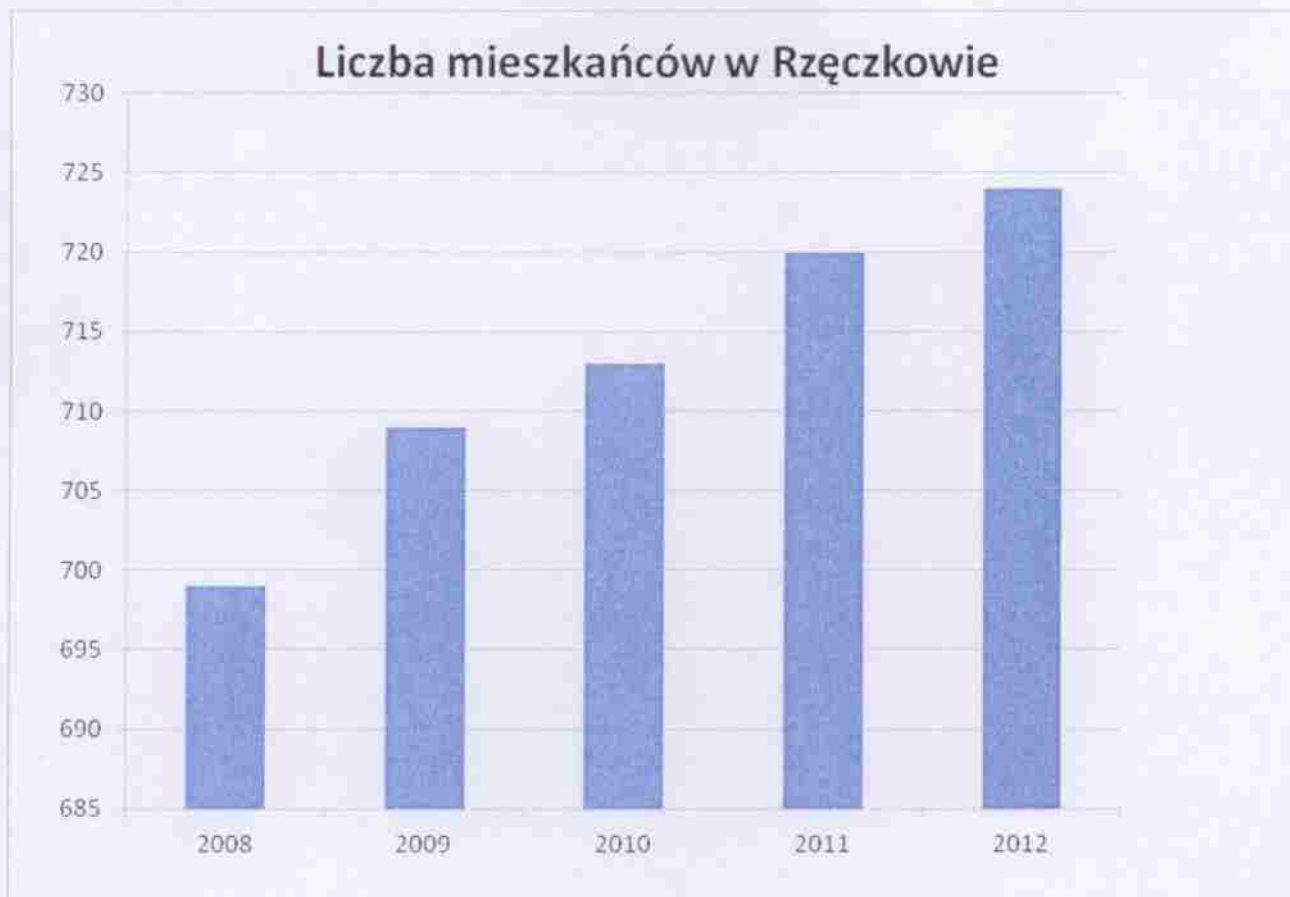
Liczba ludności w miejscowości Rzęczkowo w latach 2008- 2012